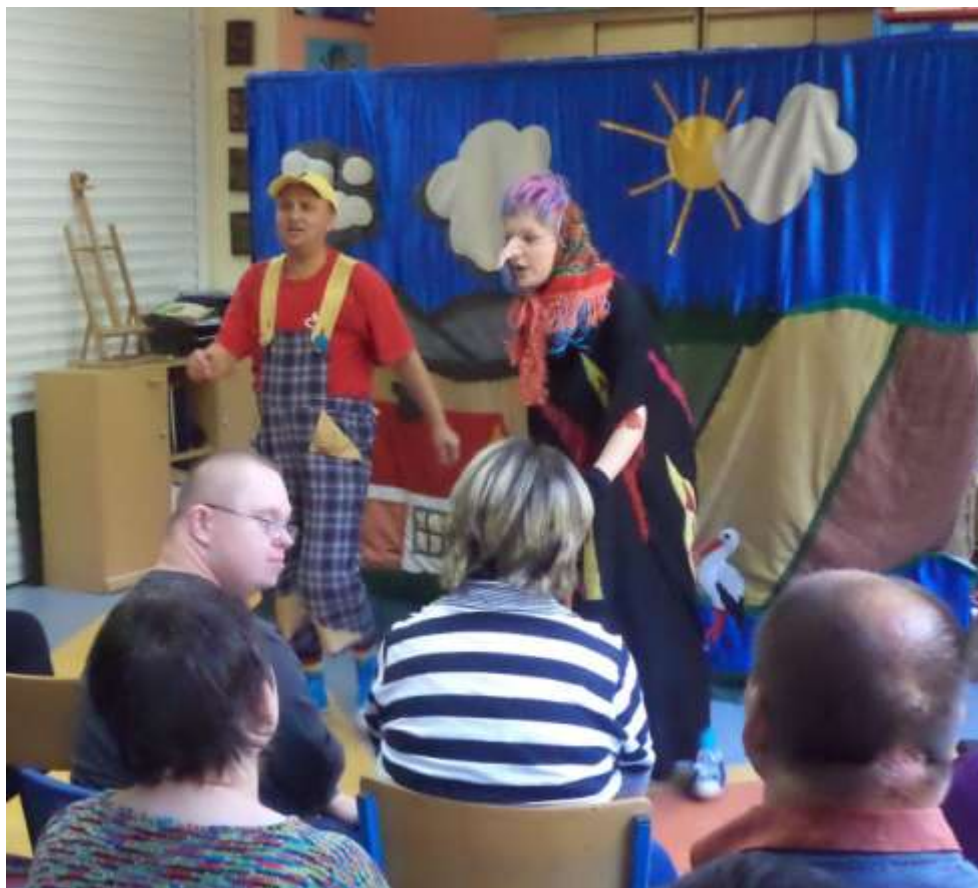
Festyn "Barierom Stop" w Lisówkach